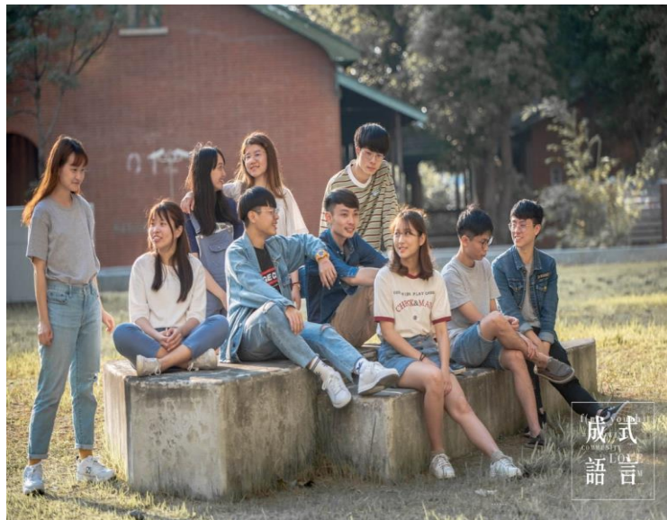
青春裡校園裡始終並肩