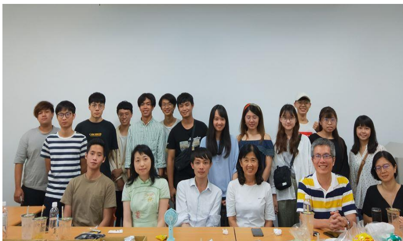
成式語言拉近世代距離 2020/06/20 成大學長姊學弟妹小串聯

109 年成大畢業歌成式語言創下 YouTube 一個多月 68 萬多的點 閱率