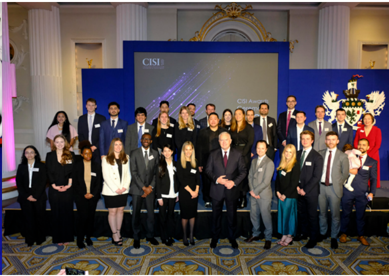
▲ 出席英國特許證券與投資協會 CISI 頒獎典禮