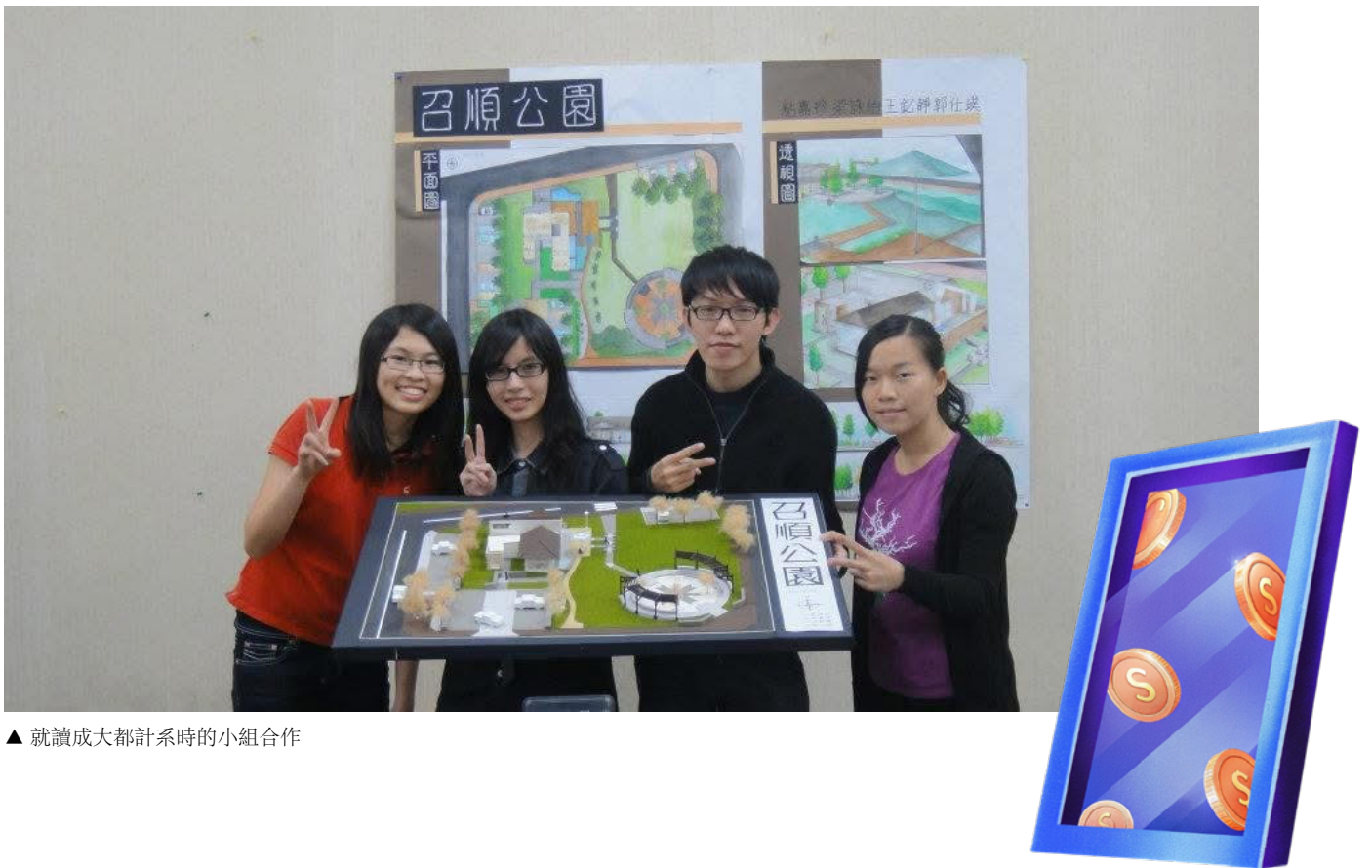
▲ 就讀成大都計系時的小組合作